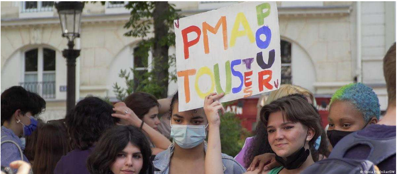
法国LGBTQ权益活动家一直在争取医学辅助生殖技术PMA（la Procréation médicalement assistée，法语的“医学辅助技术”）的普遍使用，图源网络

[4] 有关该事件的报道，详见“ France debates law to let lesbians and single women have IVF ”（ 点击标题阅读 ）